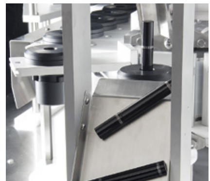
Uscita automatica del prodotto finito Automatic ejection system of the finished product