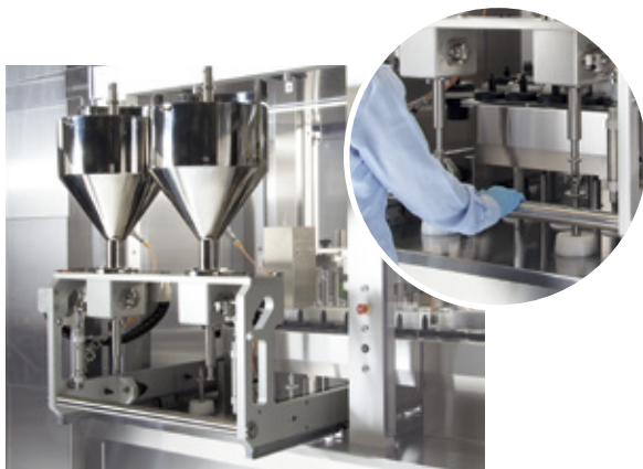
Stazione di dosaggio su carrello estraibile Hoppers and dosing group installed on a removable frame