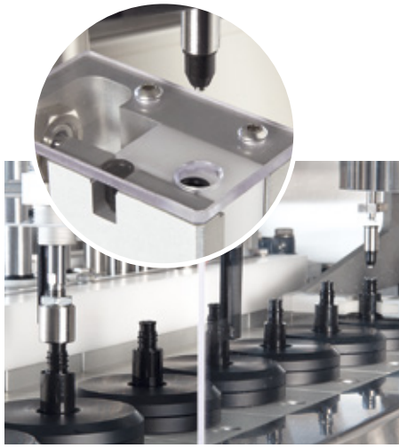
Sistema Pick & Place per l'inserimento dei riduttori Pick & Place system for wiper insert placing